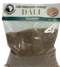
THIAKRY - 20 X 370 G