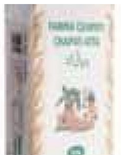
CHAPATI ALI BABA - 5 KG COD: FAC800.007