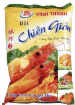
CRISP FRIED POWDER MIX BICH CHI - 30 X 150 G