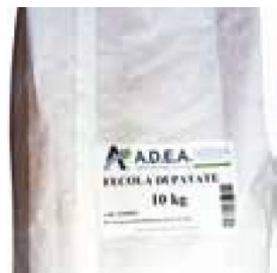
FECOLA DI PATATE - 1 X 10 KG