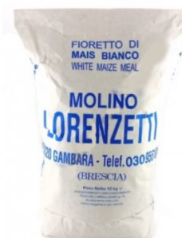
FIORETTO DI MAIS BIANCO LORENZETTI - 10 KG