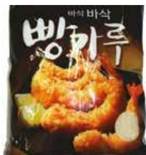
PANKO (PANGRATTATO) SURASANG - 10 X 1 KG