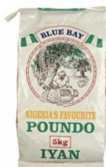
POUNDO IYAN BLUE BAY - 12 X 1 KG