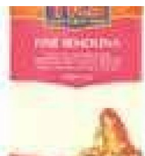
SEMOLINA FINE TRS - 6 X 1,5 KG - 9 KG COD: FAC800.021