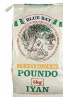
POUNO YAM EAGLE BRAND - 5 KG