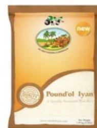
POUNDO IYAN OLU OLU