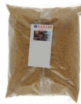
THIACRY KARA - 30 X 370 G