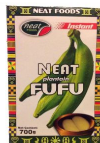
NEAT FUFU - 12 X 700 G