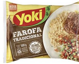
FAROFA PRONTA YOKI - 24 X 500 G