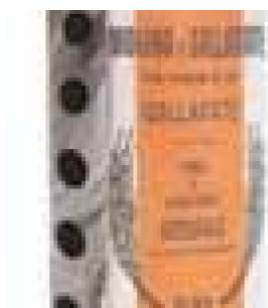
INTEGRALE GALLARATE - 25 KG COD: FAC800.001