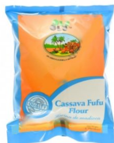
CASSAVA FUFU OLU OLU - 20 X 685 G