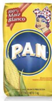
HARINA DE MAIZ PAN - 12 X 1 KG