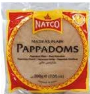
PAPADUMS (PANE INDIANO) NATCO - 60 X 200 G