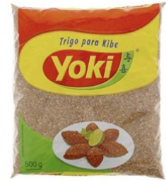
TRIGO PARA KIBE YOKI - 12 X 500 G