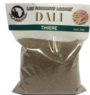
THIÈRE - 20 X 370 G