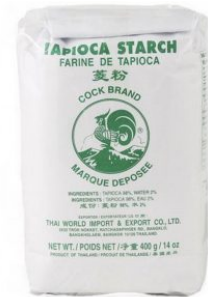
TAPIOCA STARCH COCK - 50 X 454 G