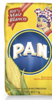
HARINA DE MAIZ YELLOW PAN - 20 X 1 KG