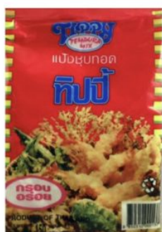
TEMPURA MIX TIPPY - 72 X 150 G