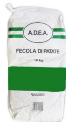
FECOLA DI PATATE LAND ADEA - 20 X 1 KG