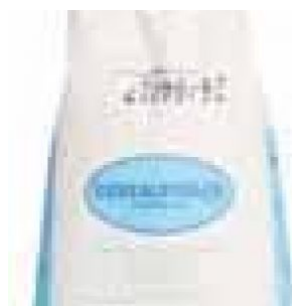
FECOLA DI PATATE - 5 KG COD: FAC800.011