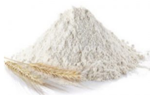
FARINA TIPO "00"