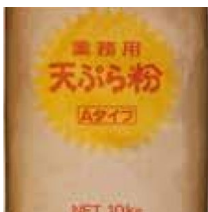
TEMPURAKO (FARINA PER TEMPURA) NISSHIN - 1 X 10 KG