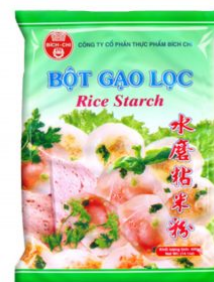
RICE STARCH BICH CHI - 25 X 400 G