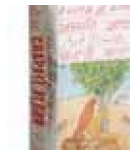
CHAPATI (BS) - 25 KG COD: FAC800.022