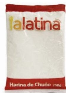
HARINA DE CHUNO LA LATINA - 24 X 250 G