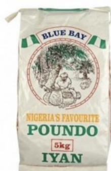
POUNDO IYAN BLUE BAY - 5 KG