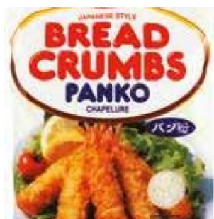
PANKO (PANGRATTATO) SUKINA - 24 X 200 G