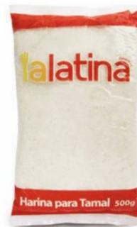
HARINA PARA TAMAL LA LATINA - 24 X 500 G