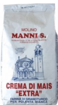
CREMA DI MAIS BIANCO MANNI S. - 5 KG