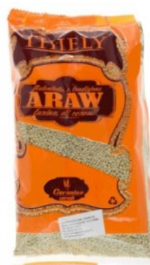
ARAW KARA - 30 X 370 G