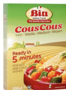
COUS COUS MEDIO BACCHINI BIA - 5 KG