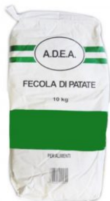
FECOLA DI PATATA GREJO LAND - 20 X 1 KG