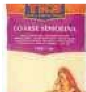
SEMOLINA COARSE TRS - 10 X 500 G - 5 KG COD: FAC800.019