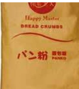
PANKO (PANGRATTATO) HAPPY MASTER - 1 X 10 KG