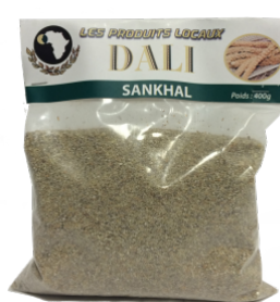
SANKHAL - 20 X 370 G