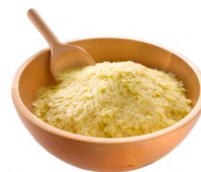
FIOCCHI DI PATATE LAMBWESTON - 25 KG