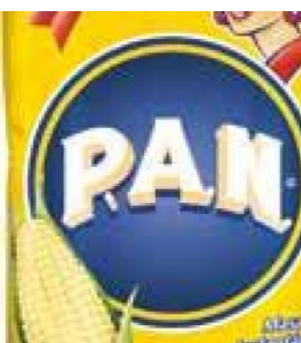
FARINA DI MAIS BIANCA PRECOTTA PAN - 10 X 1 KG