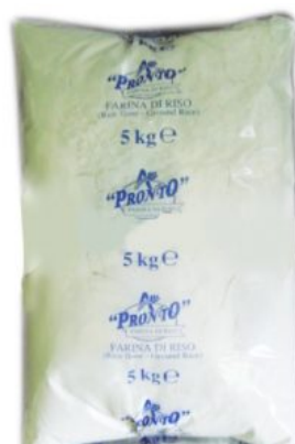
FARINA DI RISO PRONTO - 20 X 1 KG