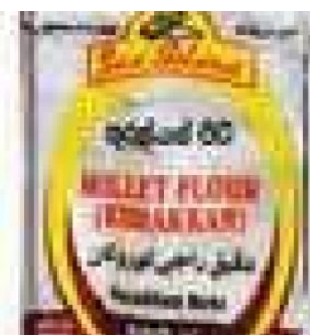
KURAKKAN FLOUR SUN ISLAND - 500 G COD: FAC800.017