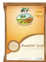
POUNDO IYAN OLU OLU