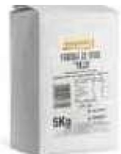
FARINA DI MAIS - 5 KG COD: FAC050.001