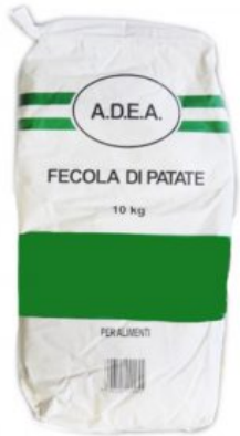
FECOLA DI PATATE ADEA - 10 KG