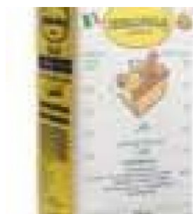
SEMOLA RIMACINATA - 25 KG COD: FAC038.010