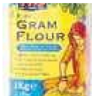
GRAM FLOUR TRS - 6 X 2 KG - 12 KG