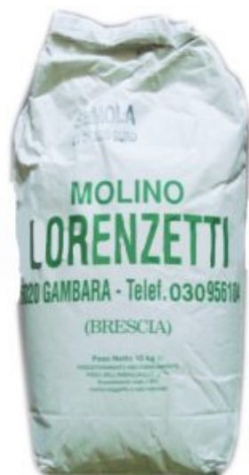
SEMOLA DI GRANO DURO LORENZETTI - 5 KG