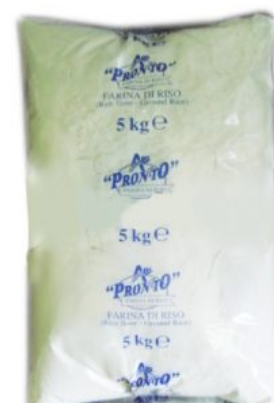
FARINA DI RISO PRONTO - 4 X 5 KG