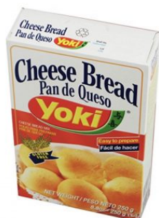
PAN DE QUESO YOKI - 24 X 250 G