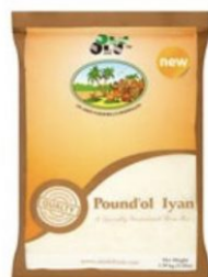
POUNDO IYAN OLU OLU