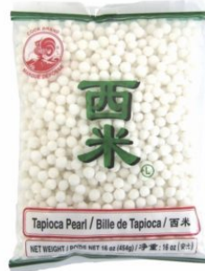
TAPIOCA PEARL LARGE COCK - 50 X 454 G