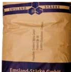
FECOLA DI PATATE - 1 X 25 KG