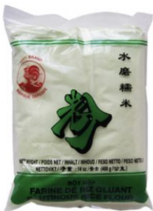
GLUTINOUS RICE FLOUR COCK - 50 X 400 G