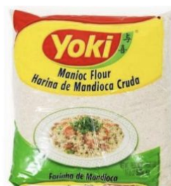
HARINA DE MANDIOCA TOSTADA YOKI - 24 X 500 G