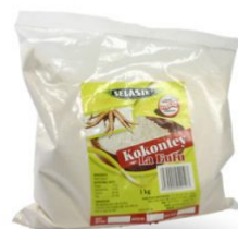
KOKONTEY LA FUFU - 30 X 1 KG