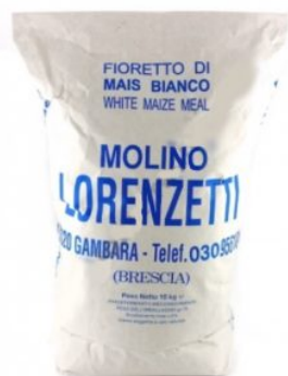
FIORETTO DI MAIS BIANCO LORENZETTI - 5 KG