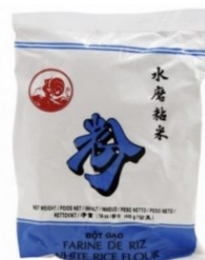
WHITE RICE FLOUR COCK - 50 X 400 G