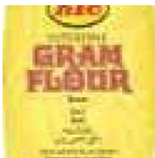
GRAM FLOUR KTC - 6 X 2 KG - 12 KG