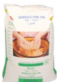
SEMOLA DI GRANO DURO FINE CEREALPUGLIA - 5 KG