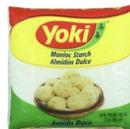
AMIDO DOCE POLVILHO YOKI - 12 X 500 G