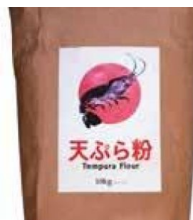
TEMPURAKO (FARINA PER TEMPURA) - 10 KG