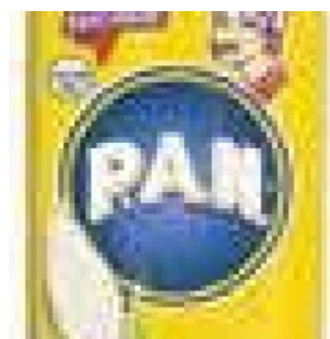
PAN MAIS FLOUR - WHITE COD: FAC800.010