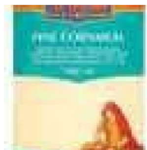
CORNMEAL FINE TRS - 6 X 1,5 KG - 9 KG COD: FAC800.012