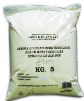
SEMOLA DI GRANO DURO RIMACINATA LAND - 5 KG