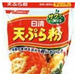
TEMPURAKO (FARINA PER TEMPURA) NISSHIN - 15 X 600 G