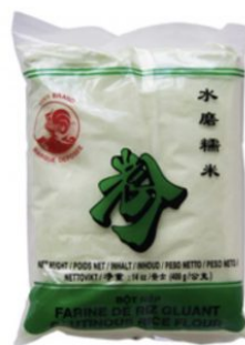
GLUTINOUS RICE STARCH BICH CHI - 25 X 400 G