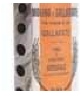
INTEGRALE GALLARATE - 10 KG COD: FAC800.002