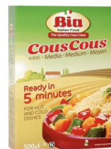
COUS COUS MEDIO BACCHINI BIA - 10 X 1 KG