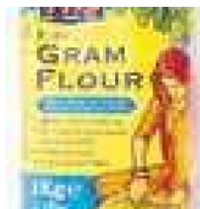
GRAM FLOUR TRS - 12 X 1 KG - 12 KG COD: FAC800.013