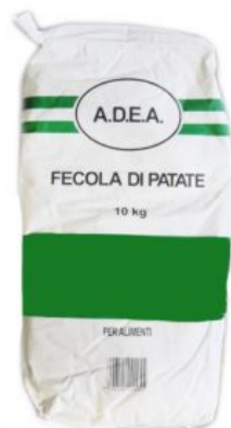
FECOLA DI PATATE LAND ADEA - 4 X 5 KG