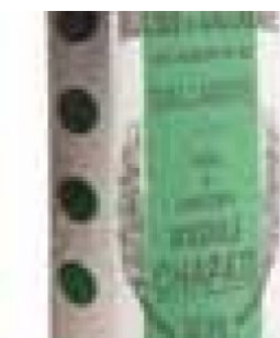
CHAPATI VARESE - 25 KG COD: FAC800.003