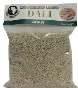
ARAW - 20 X 370 G