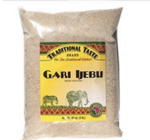
GARI - 20 X 1 KG