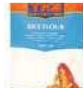
RICE FLOUR TRS - 10 X 500 G - 5 KG COD: FAC800.018