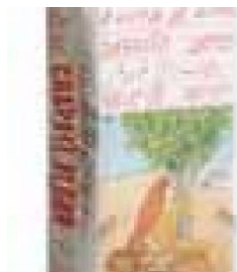
CHAPATI (BS) - 10 KG COD: FAC800.004