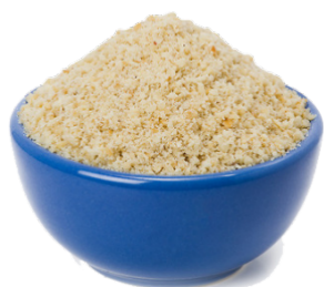
ARACHIDI IN POLVERE - 20 X 500 G