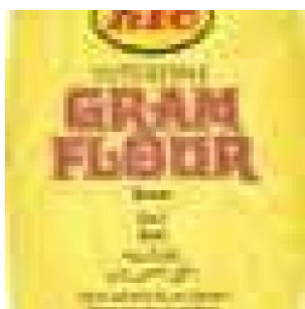
GRAM FLOUR KTC - 20 KG COD: FAC800.016