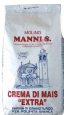
CREMA DI MAIS BIANCO MANNI S. - 20 X 1 KG