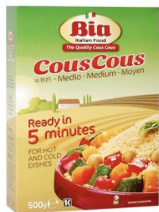
COUS COUS MEDIO BACCHINI BIA - 18 X 500 G