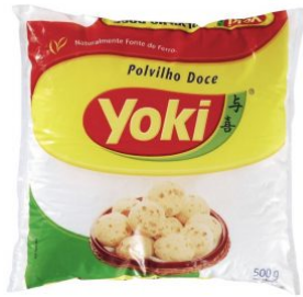
AMIDO AZEDO POLVILHO YOKI - 12 X 500 G