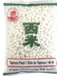
TAPIOCA PEARL SMALL COCK - 50 X 454 G