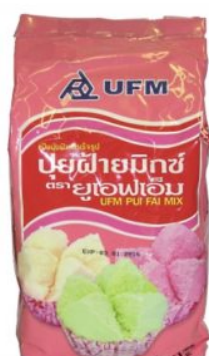
PUI FAI MIX UFM - 10 X 1 KG