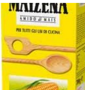
AMIDO DI MAIS MAIZENA - 12 X 700 G