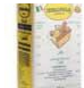
SEMOLA RIMACINATA - 5 KG COD: FAC038.004