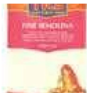
SEMOLINA FINE TRS - 10 X 500 G - 5 KG COD: FAC800.020