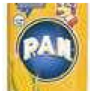
PAN MAIS FLOUR - ORANGE COD: FAC800.009