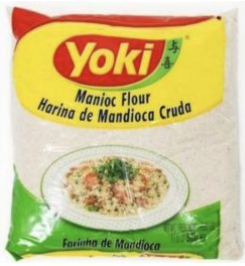
HARINA DE MANIOCA CRUDA YOKI - 24 X 500 G